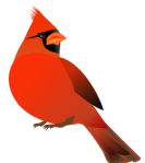
El pájaro X