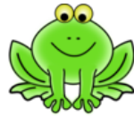
La rana X